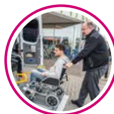
SITUATIONS DE HANDICAP